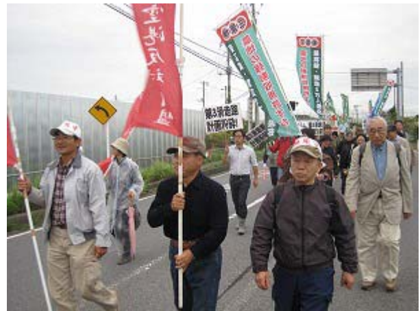
10・11全国集会の成功を勝ち取る

第3滑走路計画が開始されています。地元利権と空港の軍事使用のために、今新たに地域住民を