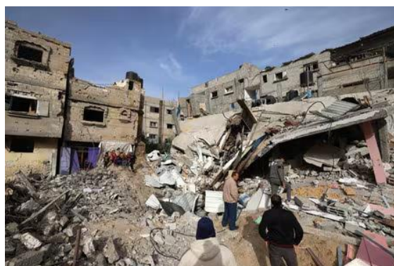
イスラエル軍により破壊された家屋。