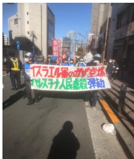
イスラエル大使館に進撃するデモ